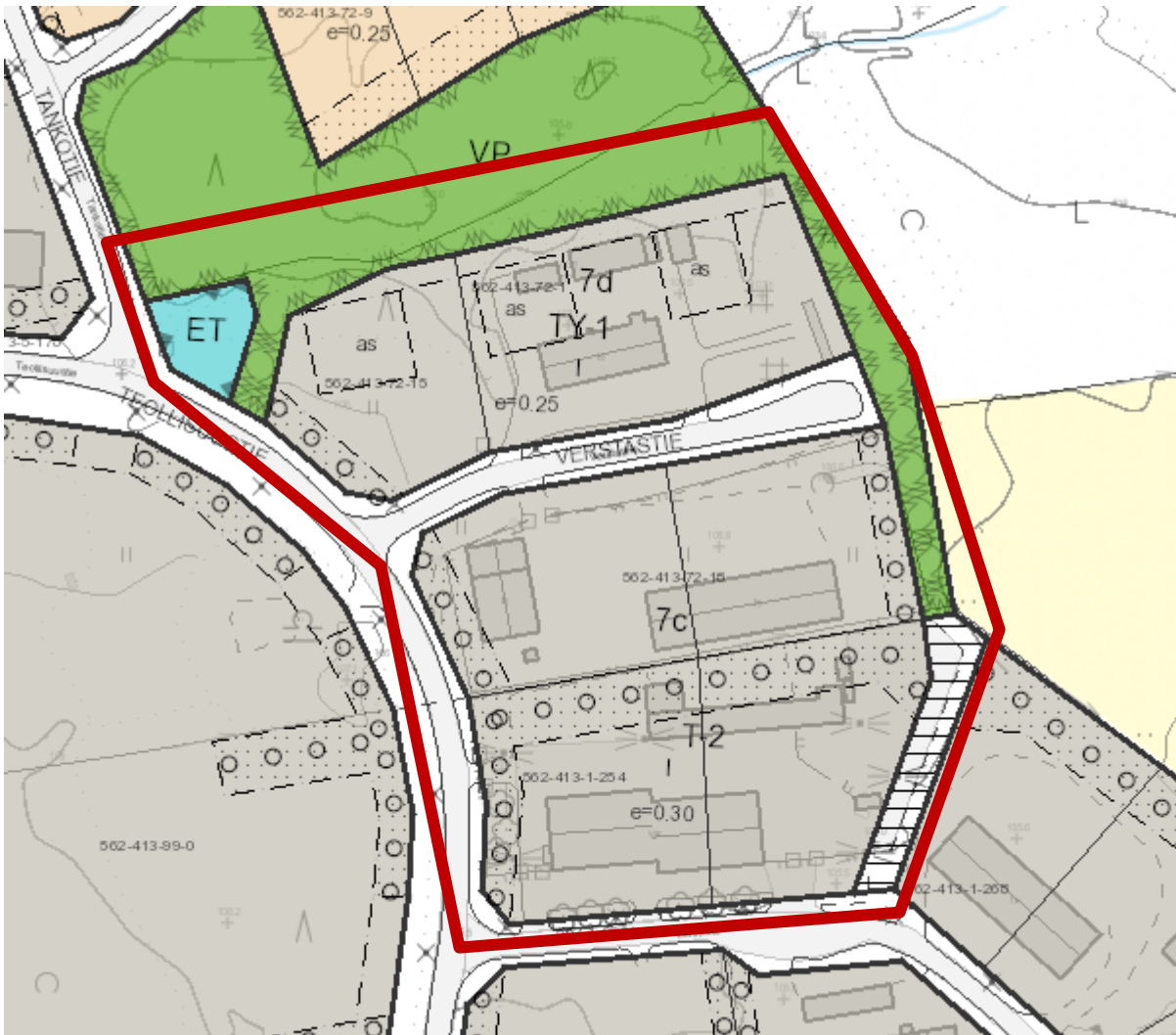
Kuva 2. Ote ajantasa-asemakaavasta. Suunnittelualueen rajausta punaisella.

Oriveden strateginen yleiskaava on hyväksytty kaupunginvaltuustossa 26.10.2020, mutta siitä on valittu Hämeenlinnan hallinto-oikeuteen. Oriveden kaupunginhallitus määräsi päätöksellään 8.3.2021 § 52 MRL 201 § nojalla strategisen yleiskaavaehdotuksen voimaan lukuun ottamatta valituksenalaista asemanrannan puunkuormausaluemerkintää Pt ja siihen kohdistuvia kehittämis- ja yleismääräyksiä. Strategisessa yleiskaavassa suunnittelualue on tiivistyvä ja kohentuva keskustaajama -merkinnän alueella.