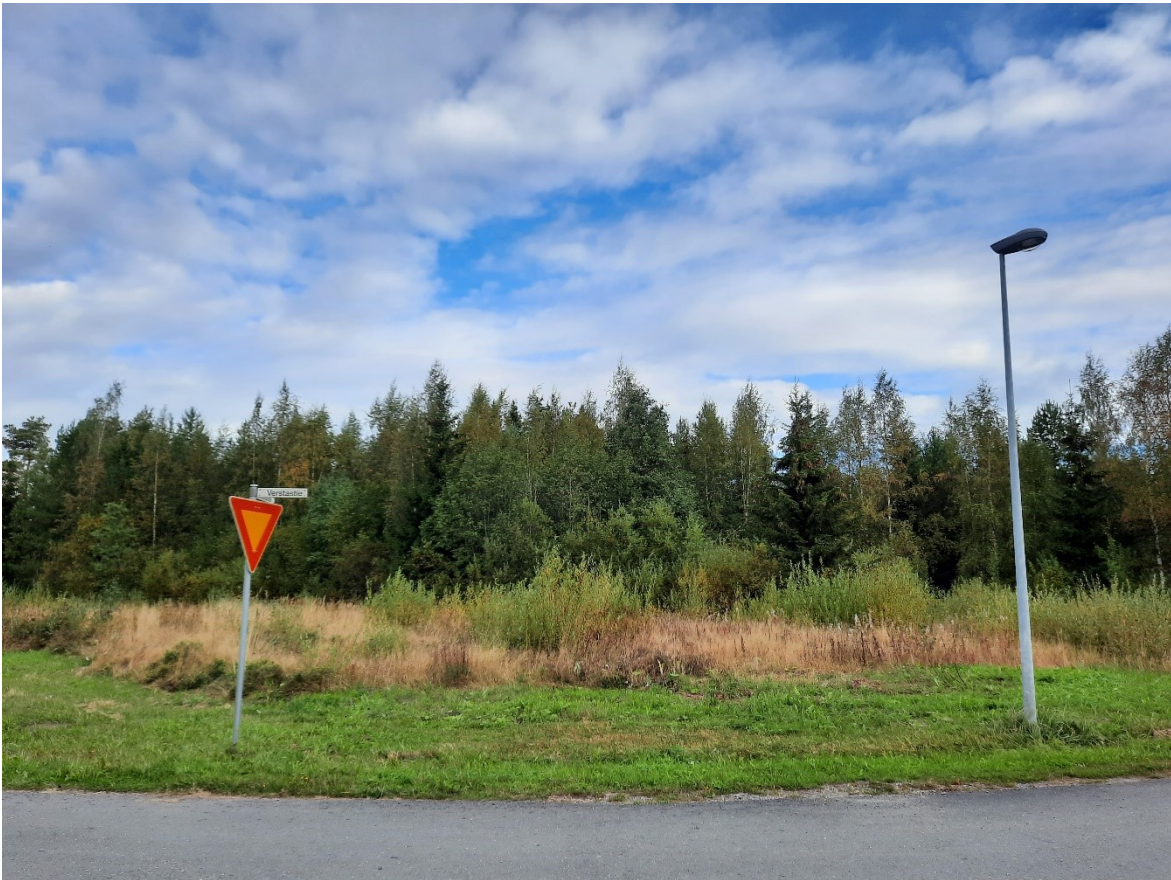
Kuva 1. Suunnittelualan rakentamattomalla tontilla on pääosin pensas- ja heinäkasvillisuutta.

GTK:n maaperäkartan mukaan koko suunnittelualan pääasiallinen maalaji on hiesu.