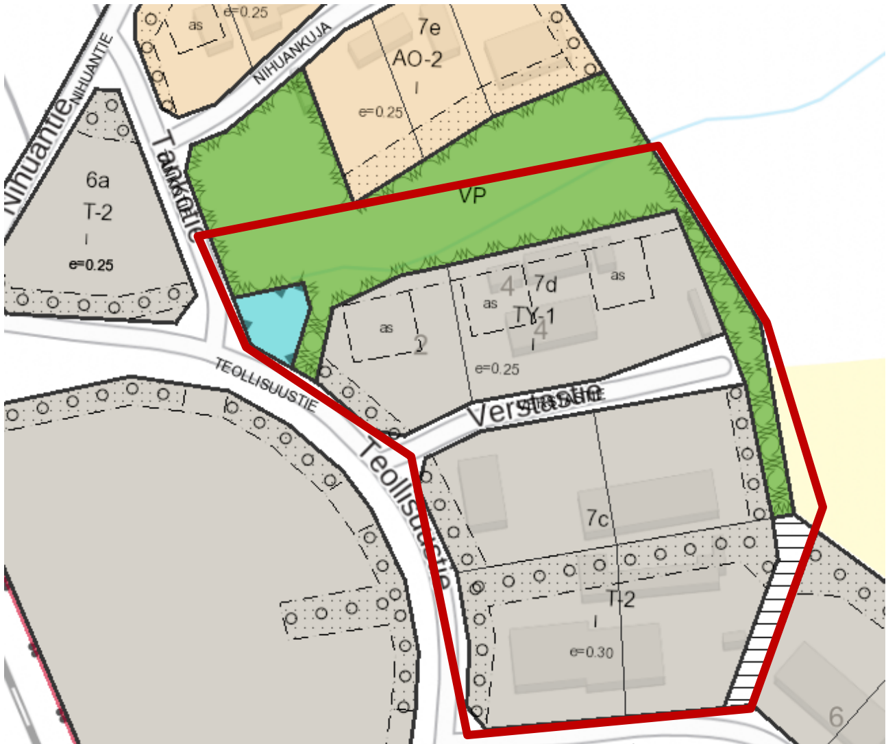
Kuva 1. Ote ajantasa-asemakaavasta. Suunnittelualueen rajaus punaisella.

Oriveden strateginen yleiskaava on tullut voimaan 16.3.2021 lukuun ottamatta valituksenalaista asemanrannan puunkuormausalue merkintää Pt ja siihen kohdistuvia kehittämis- ja yleismääräyksiä. Strategisessa yleiskaavassa suunnittelualue on tiivistyvä ja kohentuva keskustaajama -merkinnän alueella.