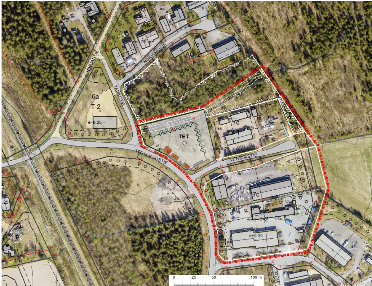
Kuva 3. Afryn laatima hyötyjäteaseman asemapiirustuksen luonnos istutettuna alueen ilmapokuvaan.