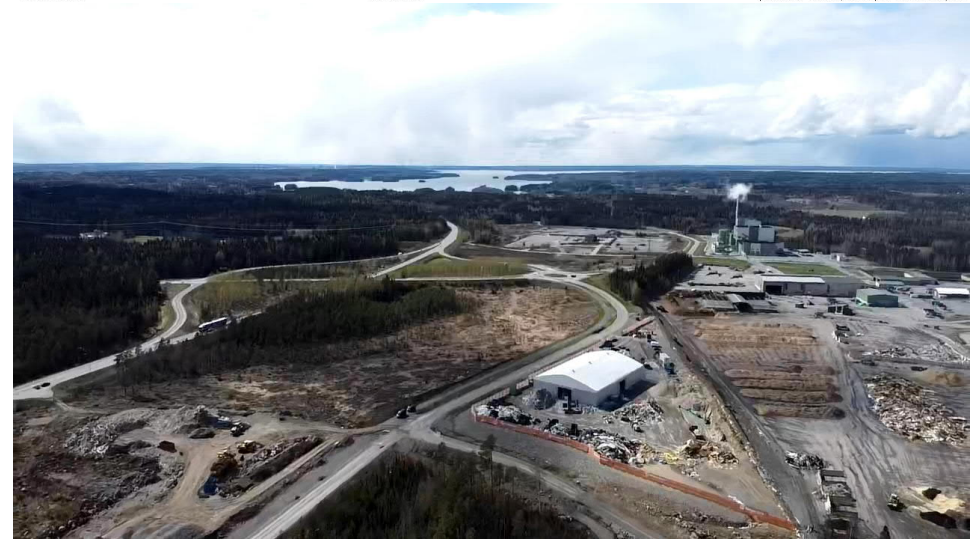
arkkitehtitoimisto ero lahti oy