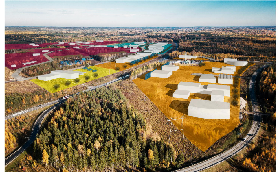
TARASTEN KIERTOTALOUSAALUE OY KANGASALA