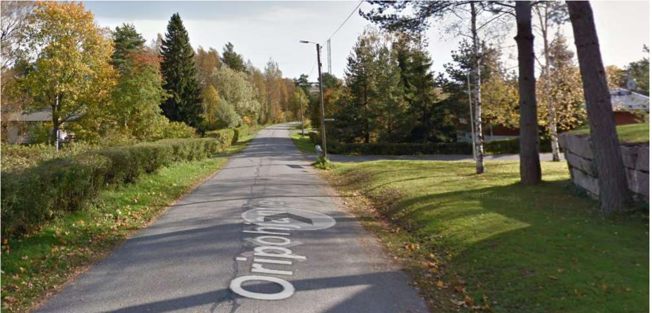
Kuva 1. Oripohjantie Rastaantie risteysalueelta plv240 luode-kaakko suunta