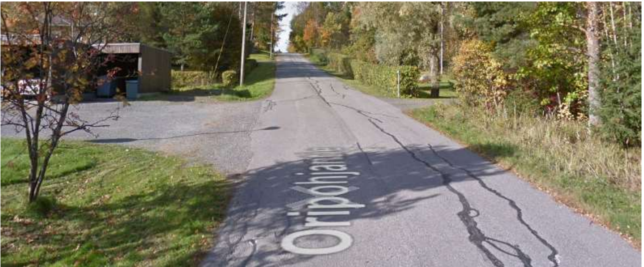
Kuva 4. Oripohjantie kaakko-luode suunta