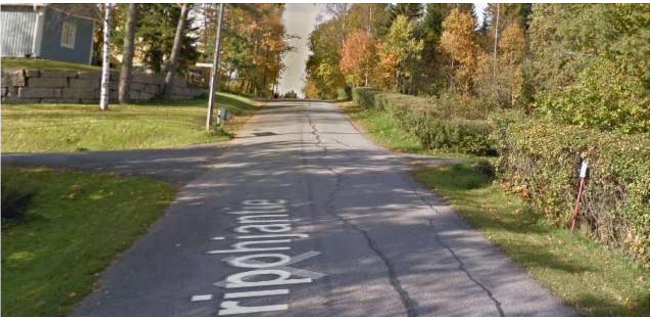
Kuva 2. Oripohjantie Rastaantien risteysalue. kaakko-luode suunta