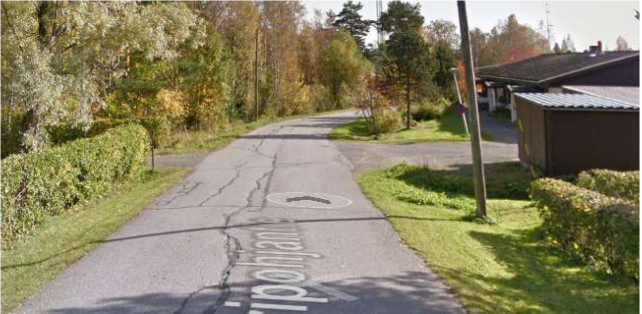
Kuva 3. Oripohjantie plv 180 luode-kaakko suunta