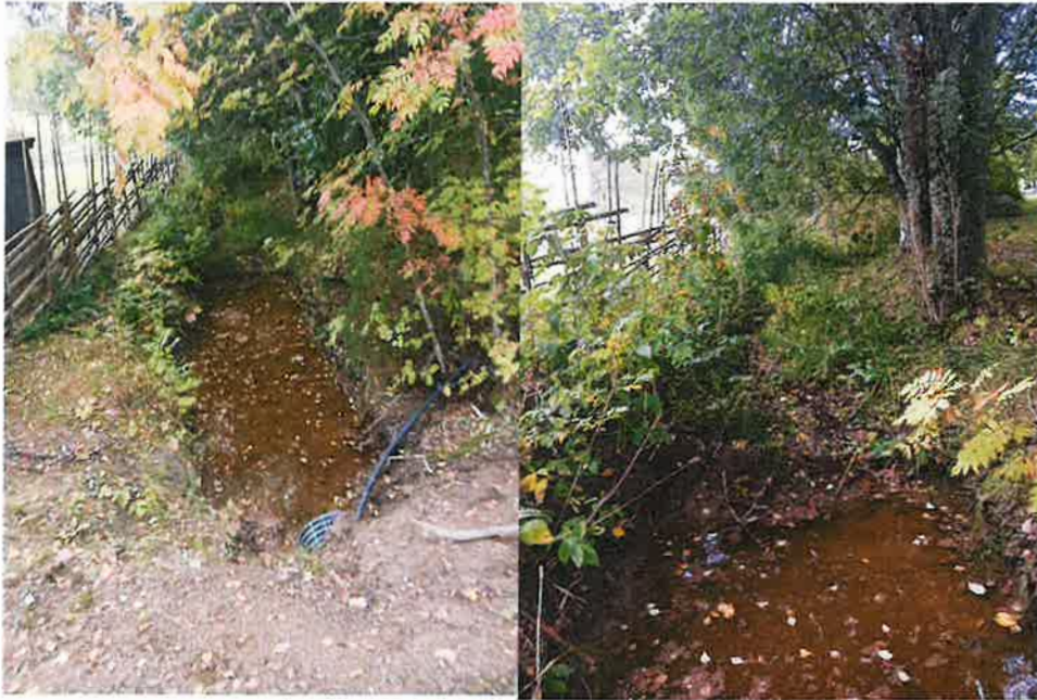
Kuvat 2 ja 3. Uoman nykytilanne

(Toisin sanoen työllä parannetaan myös yläpuolisten maa-alueiden kuten peltojen ja metsien vesitaloutta.)